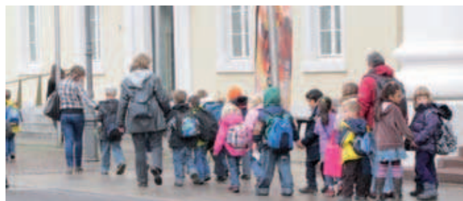
Kinder, im Stadtbild ein eher seltener Anblick. Ihnen gebührt unser Schutz!

Richtet Euch bitte auf einen etwas anderen „Lärmpegel“ ein. Sollten zu große innere oder äußere Störungen auftreten, so bittet um eine kurze Pause, damit sich alle wieder beruhigen können.