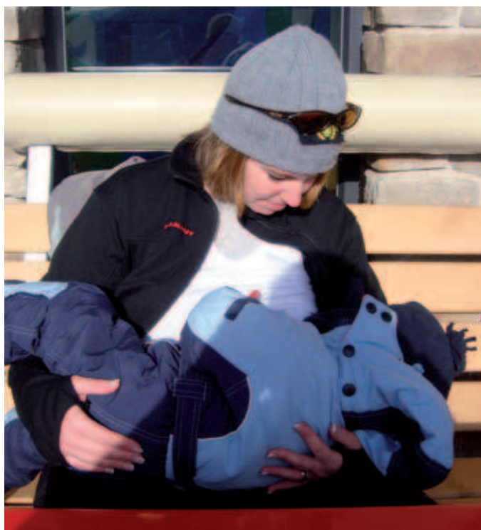
Gut angezogen ist halb gestillt...